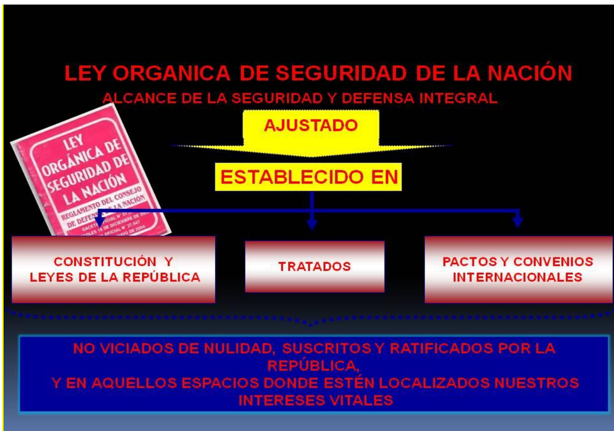
Grafico Nro. 5. Alcance de la seguridad y Defensa integral de la Nación