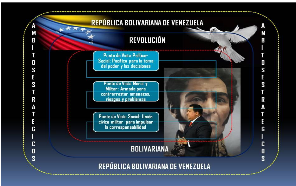
Gráfico Nro. 1. Revolución Bolivariana pacífica pero no desarmada