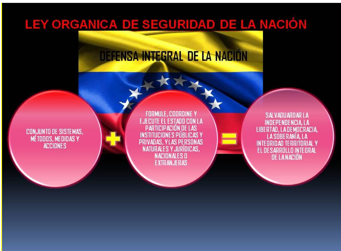
Gráfico Nro. 4. Definición de Defensa integral de la Nación

(...) es el conjunto de sistemas, métodos, medidas y acciones de defensa, cualesquiera sean su naturaleza e intensidad, que en forma activa formule, coordine y ejecute el Estado con la participación de las instituciones públicas y privadas, y las personas naturales y jurídicas, nacionales o extranjeras, con el objeto de salvaguardar la independencia, la libertad, la democracia, la soberanía, la integridad territorial y el desarrollo integral de la Nación ”. (LOSN, 2002). (Subrayado nuestro). (Ver Gráfico Nro. 4).