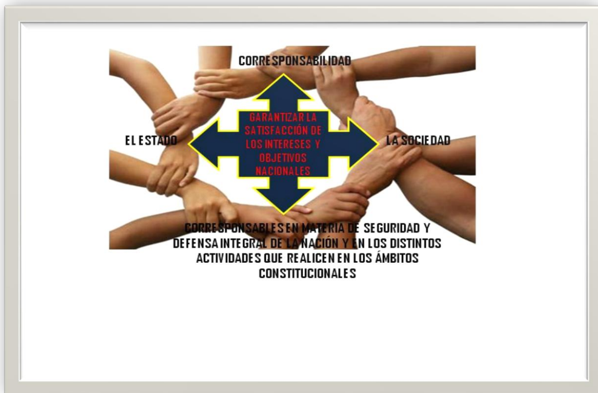
Gráfico Nro. 3. Corresponsabilidad en seguridad y Defensa integral

Lo cual, significa que cada ciudadano o ciudadana que se encuentre en la República Bolivariana de Venezuela, tiene la responsabilidad de velar por la seguridad y la Defensa integral de la misma, en los diferentes ámbitos constitucionales en conjunto o en articulación con el Estado, a fin de alcanzar los intereses y objetivos nacionales. (Ver Gráfico Nro. 3)