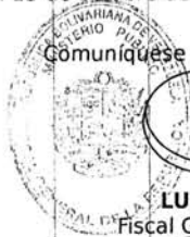
LUISA ORTEGA DÍAZ Fiscal General de la República

Despacho de la Fiscal General de la República Caracas, 05 de octubre de 2015 Años 205° y 156° RESOLUCIÓN N° 1629