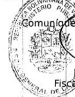
LUISA ORTEGA DÍAZ Fiscal General de la República

Despacho de la Fiscal General de la República Caracas, 09 de octubre de 2015 Años 205° y 156° RESOLUCIÓN N° 1660